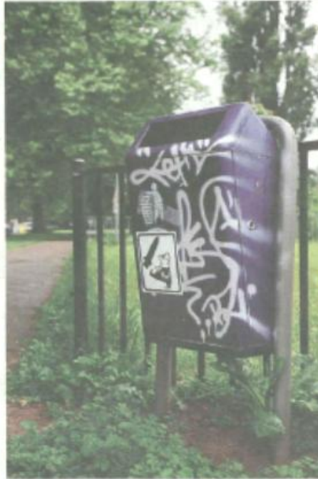
Afvalbakken in buitenwijken van Arnhem. Nu zijn er nog 1.300, straks de helft minder.

REPORTAGE GEMEENTE BEZUINIGT 650 AFVALBAKKEN WEG, BURGER KAN ZWERFVUIL MELDEN MET MOBIELTJE