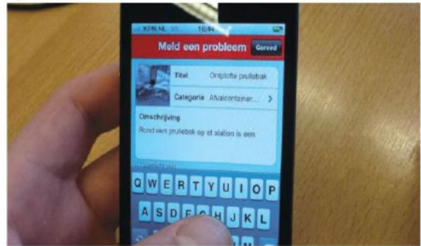
De app Opruimd.